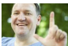
Medycyna kontra rak